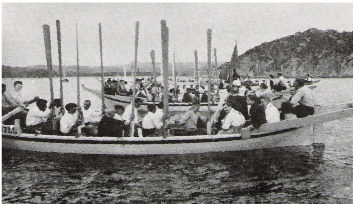
El cant de la salve, a la vista de Sant Pere del Bosc, amb els remes enlairats

Formades les respectives tripulacions que van participar en aquestes primeres dues regates de Santa Cristina, es van animar i van promoure la celebració d'altres competicions, Les primers es feien sense massa tècnica col·locant dues balises per barca el que feia que fos molt difícil de controlar i a la vegada muntar un camp de regates no massa ortodox. Al deixar-les deficientment fondejades tota la nit la meitat es van perdre. Va ser en aquest moment quan va començar a actuar el Club Nàutic. Era necessari crear una unitat de criteri, una organització més racional, adequada i segura, condicionada a les característiques de les aigües de Lloret i sobre tot dotar-la d'un reglament per aquest tipus d'embarcacions ja que per part de la Federació Catalana de Rem no en tenien i la teníem que inventar.